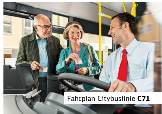
Fahrplan Citybuslinie C71