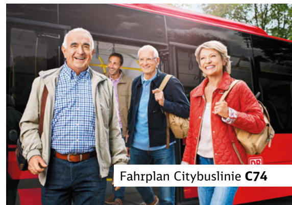
Fahrplan Citybuslinie C74