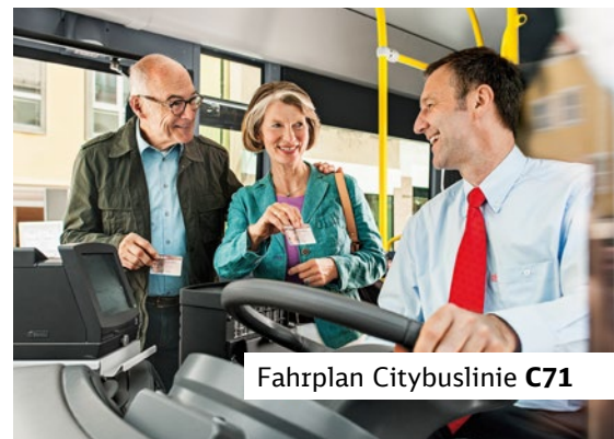
Fahrplan Citybuslinie C71