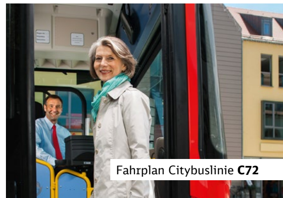
Fahrplan Citybuslinie C72